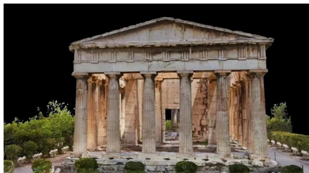
2. Гефестион в Афинах