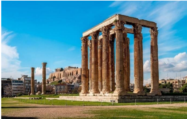
9. Храм Зевса Олимпийского в Афинах