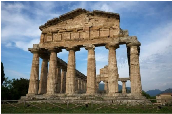
3. Храм Афины в Пестуме