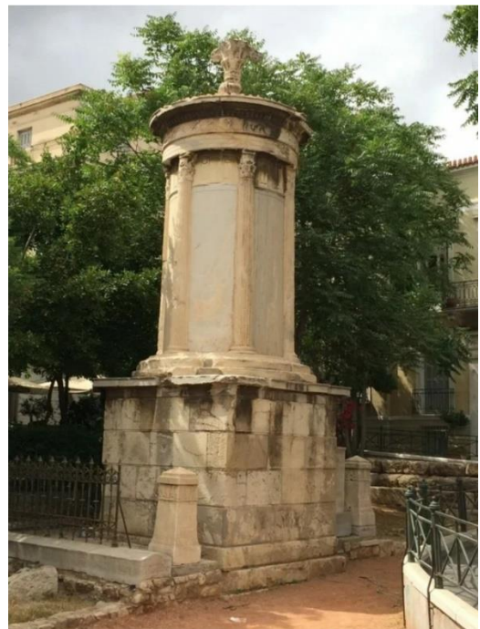
8. Памятник Лисикрата в Афинах