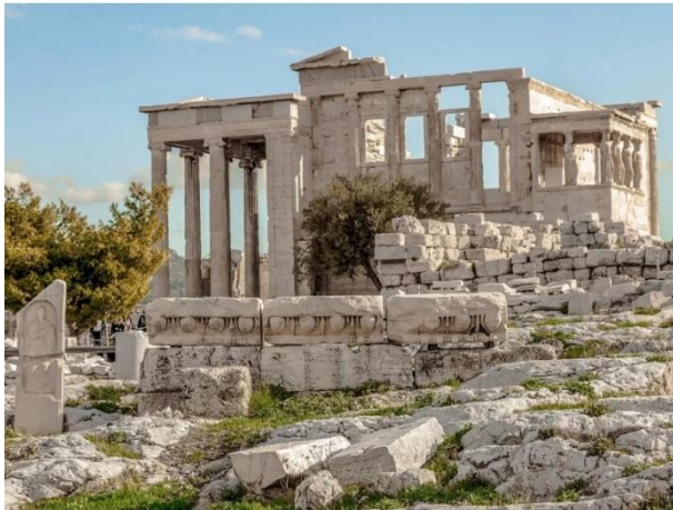
5. Эрехтейон в Афинах