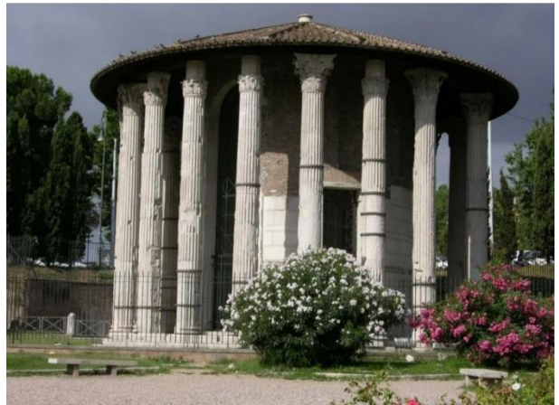
4. Храм Геркулеса Победителя на Бычьем форуме в Риме