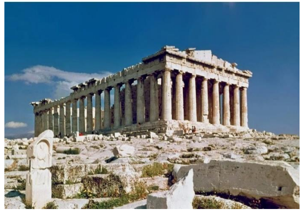
10. Парфенон в Афинах