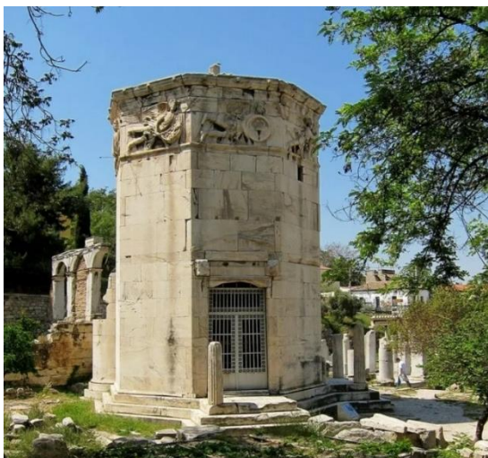
1. Башня ветров в Афинах

Найдите оригинал для каждой копии музейного собрания. Обратите внимание на то, что слепок мог воспроизводить памятник целиком, а мог быть сделан с части известного памятника.