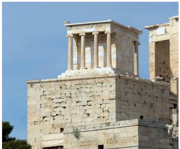
6. Храм Ники Аптерос в Афинах