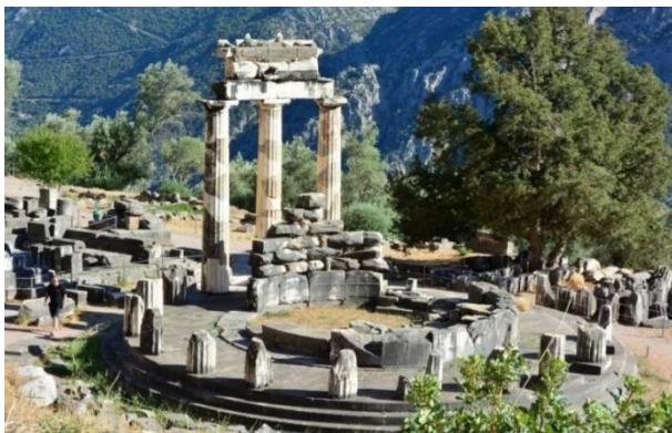
7. Храм Афины Пронайи в Дельфах